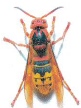
Frelon commun (jusqu'à 4 cm)