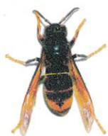
Frelon asiatique (jusqu'à 3 cm)